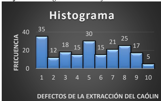
Gráfica 1. Histograma de los defectos de extracción del Caólín.