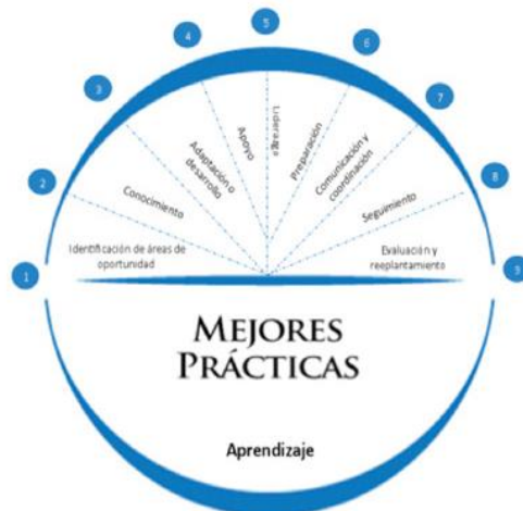
Figura 1. Componentes de las Buenas Prácticas..

Sin embargo, a lo largo de la evolución de estas prácticas, es indispensable su conocimiento y comprensión, lo que posteriormente permitirá a cada empresa evaluar la forma en la que estas podrán ser aplicadas y que en un futuro podrán contribuir a ampliar la base de Mejores Prácticas existentes.